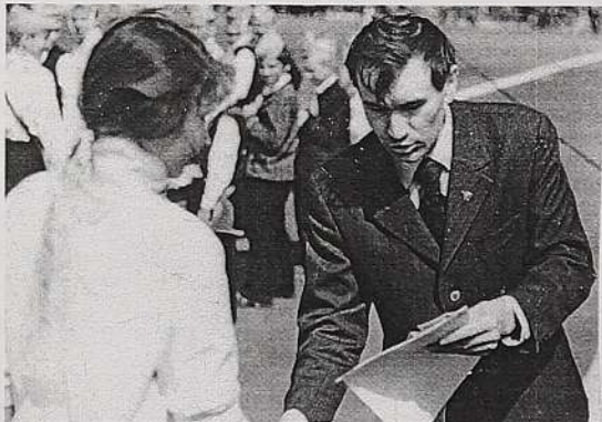
Первый секретарь ЦК ВЛКСМ Юсупов Рафис Габдрафинович вручает награду пионерке- активистке. 19 мая 1972 год.

Яркой личностью был наш первый секретарь Юсупов Рафис Габдрафинович (ныне работает начальником гидроучастка) в г.Мелеузе.