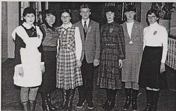
Комсомольская конференция 17 ноября 1984 года