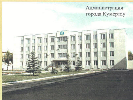
Администрация города Кумертау